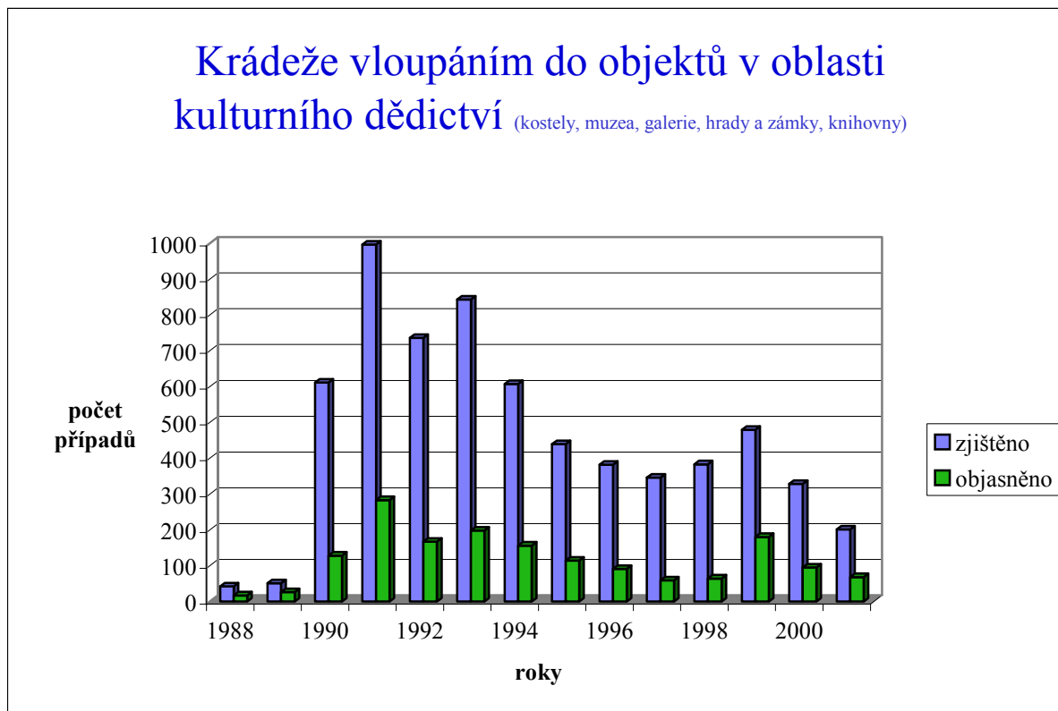
Graf č. 1